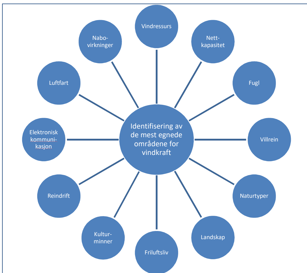
Figur 1. Noen av temarapportene som skal brukes til å identifisere områder

I denne temarapporten vurderes virkninger for drikkevann. Annen forurensning blir også kort vurdert. Konklusjonene fra rapporten vil inngå i kunnskapsgrunnlaget NVE skal levere til OED som en del av forslaget til en nasjonal ramme for vindkraft. Rapporten blir en del av grunnlaget for å identifisere de områdene i Norge som er mest egnet for vindkraft. Den blir også et grunnlag for fremtidig konsesjonsbehandling.