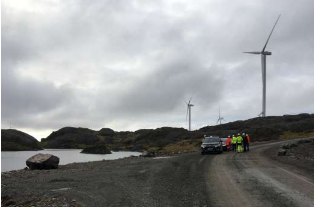
Figur 2. Tilsyn ved Egersund vindkraftverk